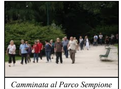
Camminata al Parco Sempione

L'esercizio andrà definito nei dettagli con il diabetologo.