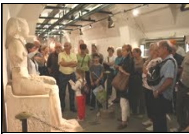
Camminata al Parco Sempione Visita al Museo Egizio

Sembrerà contraddittorio, eppure la persona con diabete parte più avvantaggiata dovendosi prima di tutto confrontare con gli esperti e finisce così per saperne di più sull'utilizzo degli alimenti in termini di carboidrati piuttosto che di grassi o di proteine necessarie per assecondare lo sviluppo dei muscoli; tutti aspetti che portano una persona con diabete a controllarsi prima dell'attività.