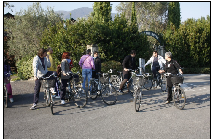
Iseo - Bicicletata

soprattutto, se si è soggetti insulino-trattati al fine di valutare l'introito calorico di un pasto sapendo che durante o distanza di tempo possono insorgere delle ipoglicemie.