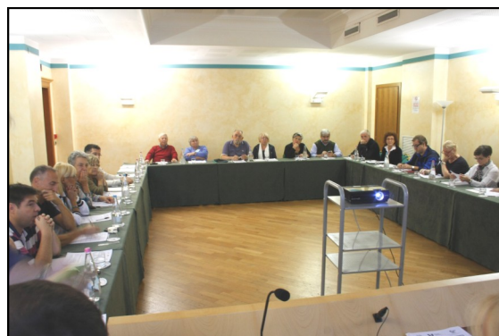
Iseo - Un momento dei lavori

In secondo luogo: nel Seminario manca l'aspetto