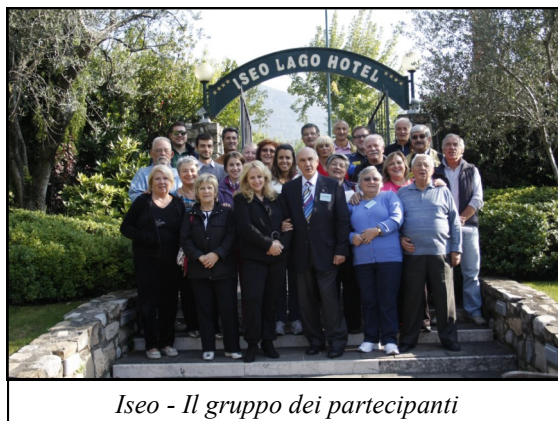
Iseo - Il gruppo dei partecipanti

Da anni, infatti, l'Associazione tiene dei Seminari educativi/informativi, a cadenza mensile, chiamando i più illustri clinici della regione a parlare di diabete, delle sue