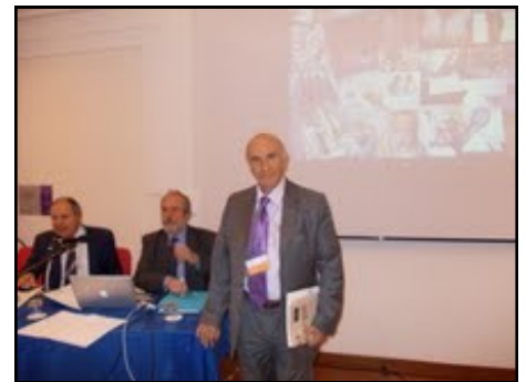
Pres. Raffaele alla Conferenza Nazionale delle Associazioni del

Mi sono chiesto, in particolare, come potrebbe reagire il giovane in questo passaggio contrassegnato dall'inserimento nel mondo del lavoro piuttosto che dall'ingresso in Università. Il dubbio maggiore (e qui dichiaro la mia ignoranza) mi è sorto quando mi sono chiesto come gestire il passaggio tra il Centro Diabetologico